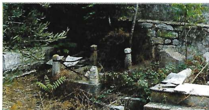
г.Бизерта, кладбище, могила Вл. Вл. Никола (до приборки)